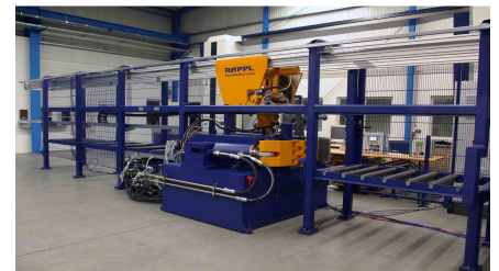
Das Leistungsspektrum der Rappl GmbH beinhaltet auch die Erstellung von Komplettlösungen für Kunden spezifische Sondermaschinen

Als ebenfalls sehr effektiv hat sich das im ERP-System integrierte Dokumentenmanagementsystem (DMS) erwiesen. In einem digitalen Archiv verwaltet die Software z. B. alle relevanten Daten eines Auftrags von der ersten Kundenanfrage bis zum Prüfsertifikat des ausgelieferten Produkts. Eingescannte Papierdokumente und Konstruktionszeichnungen, Grafik-Dateien, Word-Dokumente, Messdaten oder Videos stehen in einer einheitlichen Struktur zur Verfügung. Über Artikel-Nr. oder auch freie Suchbegriffe bietet das übergreifende Dokumentenmanagement den sofortigen Zugriff auf das jeweils gewünschte Dokument. So können z. B. während eines Telefonats mit einem Kunden sofort sichere Aussagen getroffen werden. In einem anderen Anwendungsfall können im Rahmen der Kalkulation ähnliche Teile mit entsprechenden Suchkriterien selektiert werden. Mit einer Kopierfunktion wird ein neuer Artikel angelegt und durchkalkuliert.