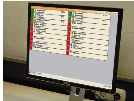
Monitoring der Anwesenheit der Mitarbeiter via bisoft BDE der gbo datacomp GmbH

Mit den erfassten Daten stellt das Softwarepaket bisoft BDE der Produktionsleitung aussagefähige Schicht- und Personalpläne zur Verfügung und generiert einen Betriebskalender. Diverse einzelne und kumulierte Auswertungen bzgl. Arbeitszeiten, Kostenstellen und Aufträge über frei definierbare Zeiträume lassen sich abrufen. Des Weiteren dienen die Daten zur Abbildung der Fertigungssituation aus dem Betrieb im Kapazitätsleitstand des Mitran ® 4T ERP-Systems. „Welchen Stellenwert die Kopplung zu dem vorhandenen BDE-System einnimmt, wird deutlich durch die lückenlose Erfassung der auftragsbezogenen Betriebsdaten und des tatsächlichen Verbrauchs. Diese Erfassung ermöglicht die schnelle Verfügbarkeit der Daten zur Auswertung und schafft hohe Transparenz in der Fertigung. Jederzeit sind Soll-Ist-Vergleiche und Nachkalkulationen möglich“, stellt Rudolf Ruhland fest.